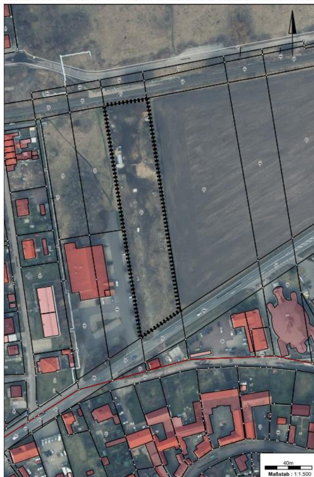
Anlage 1 - Geltungsbereich Bebauungsplan Nr. 18 "Sondergebiet Photovoltaik Braunsdorf"

Siegel - Schmitz Bürgermeister Stadt Braunsbedra