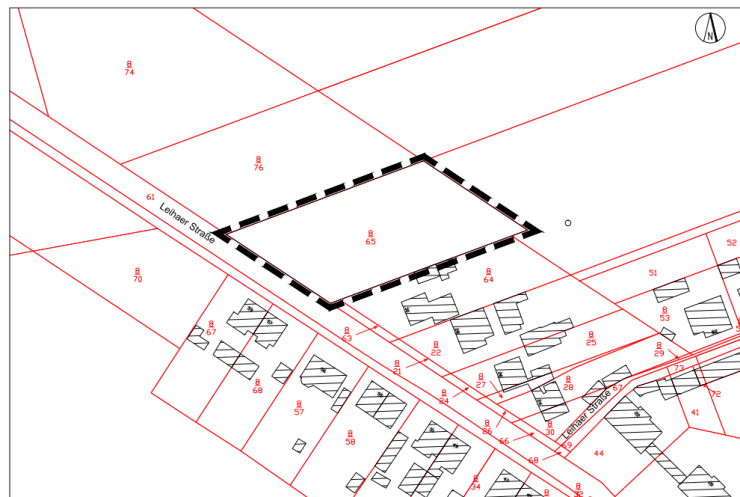
Anlage: Geltungsbereich - Einbeziehungssatzung "Leihaer Straße" in Roßbach