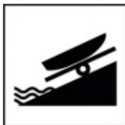
Stelle zum Ein- und Aussetzen

Die Stellen werden mit folgendem Piktogramm gekennzeichnet: