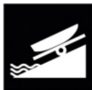
Stelle zum Ein- und Aussetzen [nur für Fahrzeuge ohne Eigenantrieb]