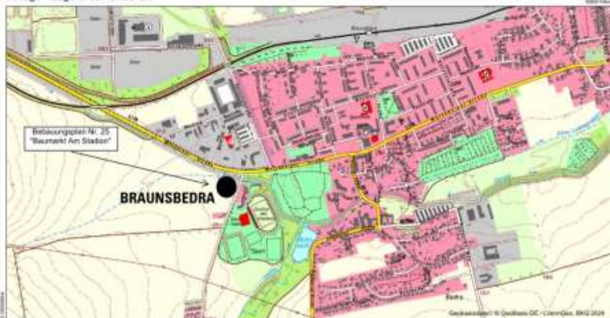
Anlage - Lage in der Ortschaft

Kartenauszug: © GeoBasis-DE / LVermGeo LSA, 2018, A 18-8004860-13| Es gelten die Nutzungsbedingungen des LVermGeo LSA.